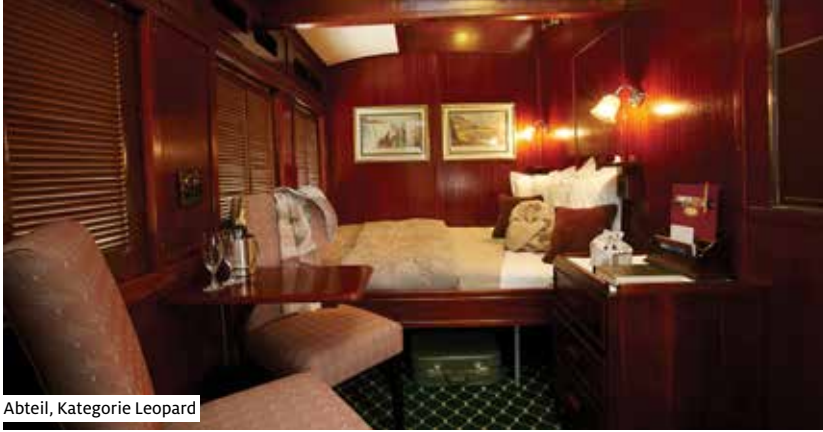
Abteil, Kategorie Leopard