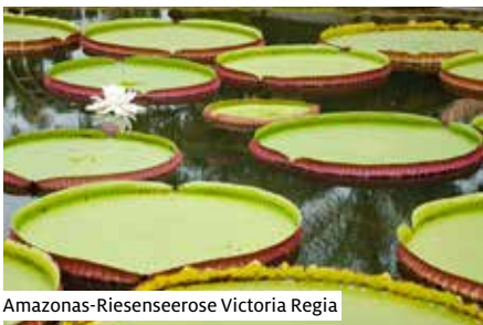
Amazonas-Riesenseerose Victoria Regia