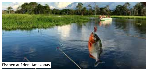
Fischen auf dem Amazonas