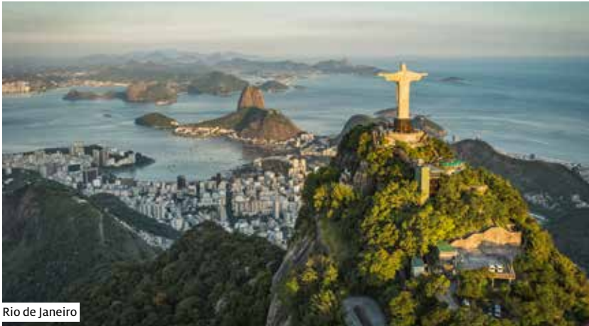
Rio de Janeiro