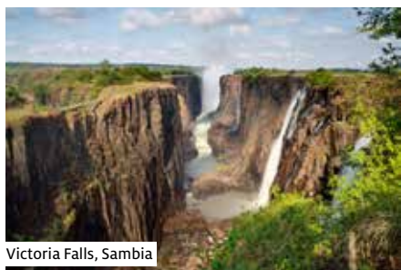
Victoria Falls, Sambia

Nicht inbegriffen: An-/Rückreise zum/vom Flughafen Zürich, Versicherungen, übrige Mahlzeiten, Getränke (in Hotels/Restaurants), Trinkgelder, Visagebühren Tansania CHF 105 (vor Abreise) sowie Sambia und Simbabwe zweifache Einreise (vor Ort zahlbar), Auftragspauschale CHF 25 p.P. (entfällt bei Buchung über thurgautravel.ch )