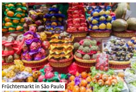
Früchtemarkt in São Paulo