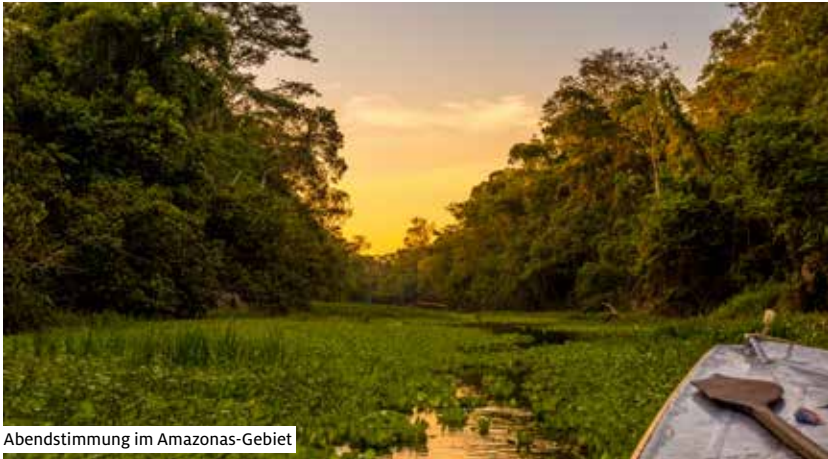
Abendstimmung im Amazonas-Gebiet