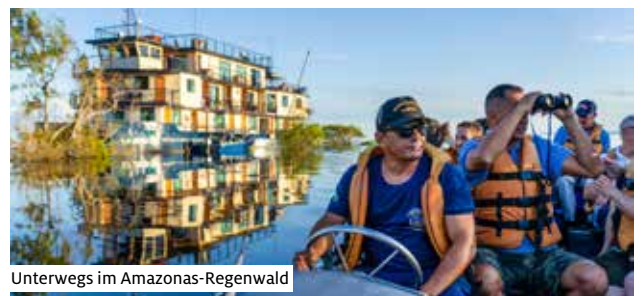
Unterwegs im Amazonas-Regenwald