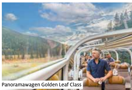
Panoramawagen Golden Leaf Class