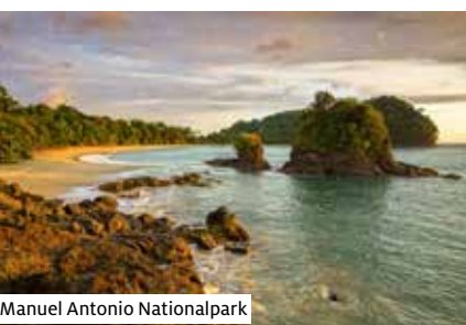
Manuel Antonio Nationalpark