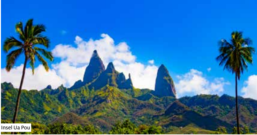
Insel Ua Pou