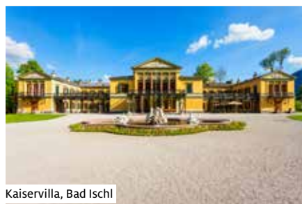
Kaiservilla, Bad Ischl