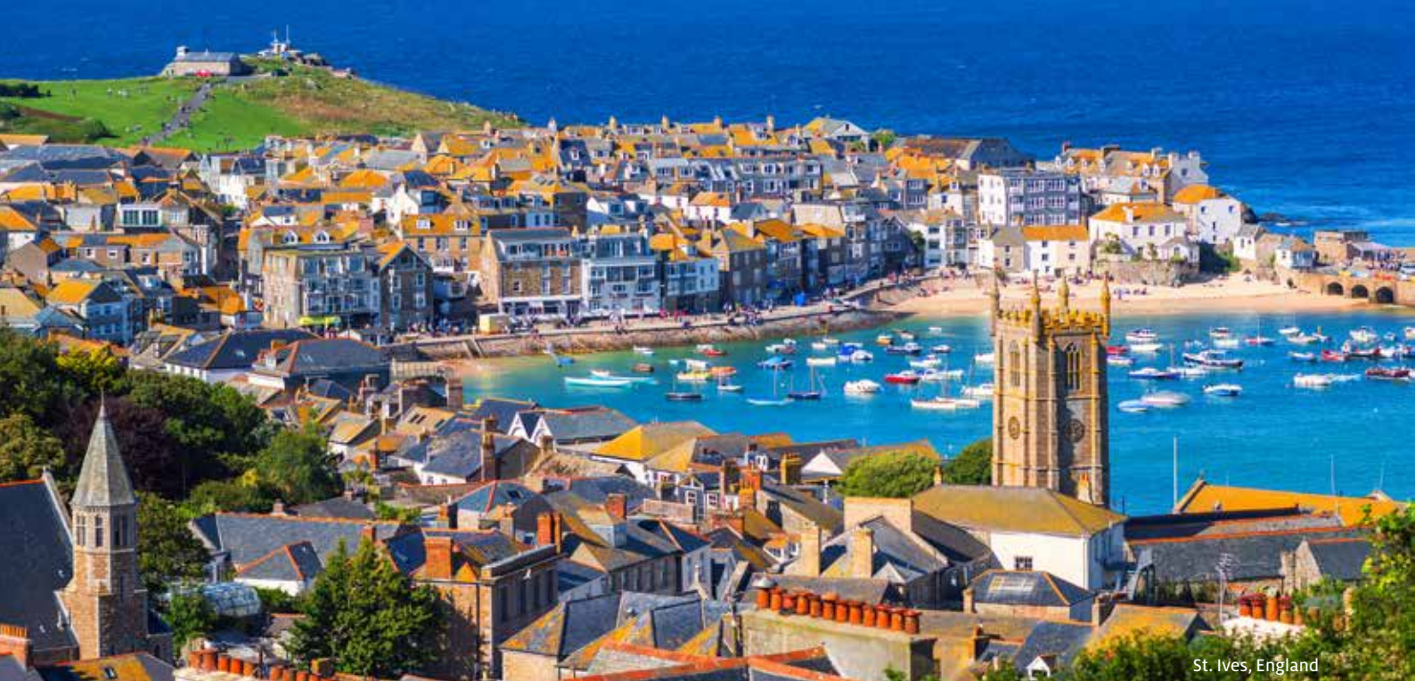
St. Ives, England