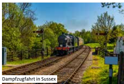
Dampfzugfahrt in Sussex