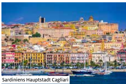
Sardinien Hauptstadt Cagliari

Sie wählen Ihren Bus-Einsteigeort Aarau, Basel, Bern, Bellinzona, Luzern, Pfäffikon SZ, Sargans, St. Gallen, Thun, Winterthur, Zürich