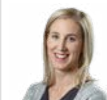
Petra Assalve Afrika & Indischer Ozean